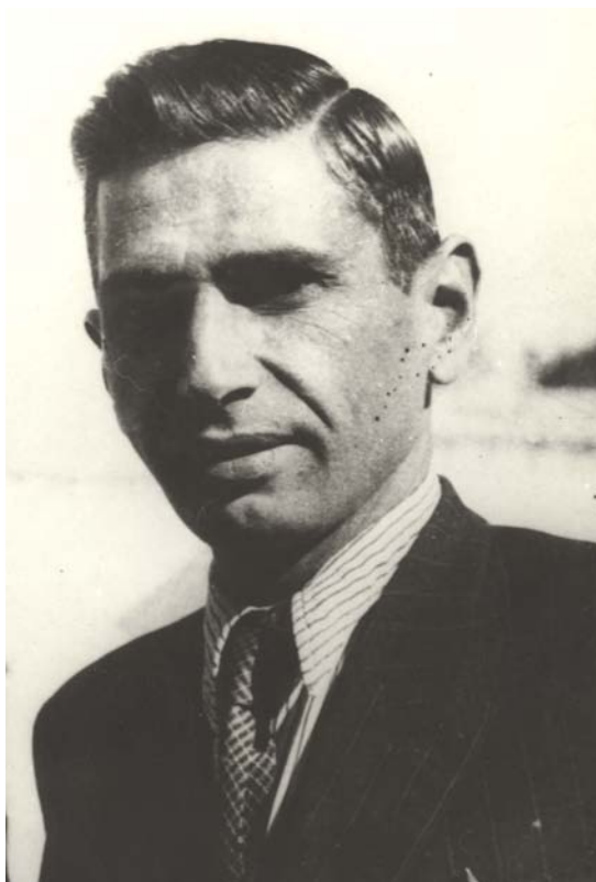
دکتر رضا رادمش وکیل مجلس در دوره چهاردهم و دبیر اول حزب توده ایران [۳۲۱-۱۷۲ع]

که یکی از شرکاء جمعیت است موفق به دستگیری مشهدی جعفر مشهور به مشهدی و آرداشس رشتی که از مؤسسين اصلی کمیته و از اداره جلیله کل تشکیلات نظمیة مملکتی امر به تعقیب مشارالیهما صادر شده بود گردید. ۲۰